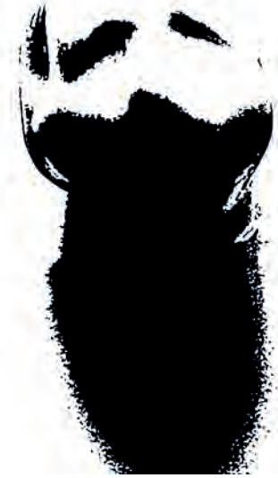
Unclear Head tai Fuck, what is wrong with me, again? Sumea Pää tai Vittu, mikä minussa on taas vialla?

Kuten tiedetään, tuottavuus on yhteydessä seksuaalisen energian – jota myös kutsutaan elämänvoimaksi – kanssa. Tämä objekti kiihdyttää itsevarmuuden tunnetta. Seksuaalienergian chakra liitetään myös taloudelliseen menestykseen. Kokeile sitä ja onnea matkaan!