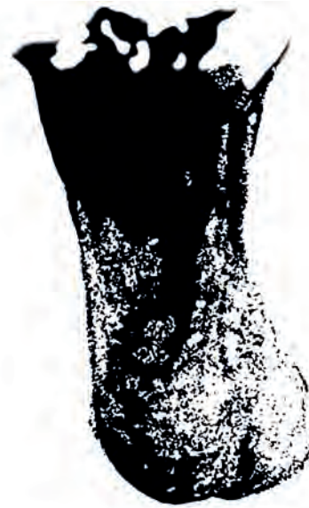
Superproductive Kernel Huipputottelias Ydin

Eräänlainen koru. Auttaa vahvistamaan oman kannanottosi voimaa. Huomaa, että voit lisätä Fuckerin kohotettuun nyrkkiin. Smart Ass Fucker on besserwisserin, eli sellaisen ihmisen symboli, jolla on tietoa. Hän tietää kaiken ja hänellä on usein radikaaleja mielipiteitä lähes kaikenlaisista asioista. Ehkä siksi, että hän lukee paljon, tai siksi että hän vain tietää kaiken. Hän on kriittinen ja pystyy tekemään tarkkoja ja oikeita kysymyksiä.